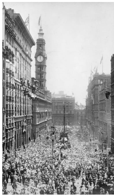
Sydney, NSW, 11 November 1919.

The 11th hour of the 11th day of the 11th month attained a special significance in the post-war years. The moment when hostilities ceased on the Western Front became universally associated with the remembrance of those who had died in the war.